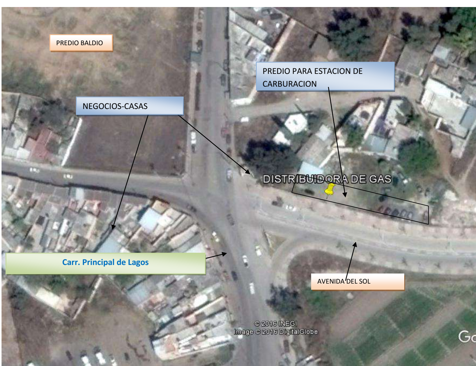
Figura: " ESTACION DE CARBURACION DE GAS L.P. DE LA EMPRESA DISTRIBUIDORA DE GAS DE LAGOS S.A. DE C.V", UBICADA EN LA COMUNIDAD DE SANTA ELENA, GTO.

Ubicación del Predio en el sistema google: