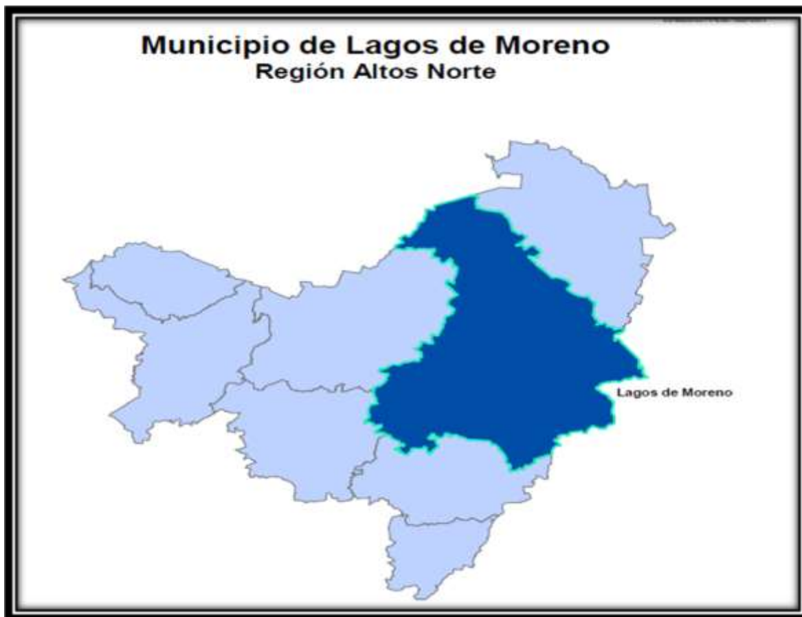
Figura 5: ubicación del municipio de Lagos de moreno en el estado de Jalisco

Moreno (cabecera municipal), Paso de Cuarenta (San Miguel de Cuarenta), Fraccionamiento Cristeros, Los Azulitos y Betulia.