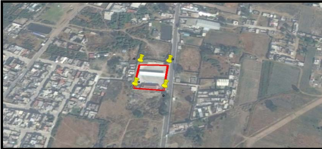
Figura 1.2 Ubicación del Proyecto

La ubicación del poligonal de terreno que ocupa la estación de servicio bajo estudio, se menciona en el siguiente cuadro de coordenadas: