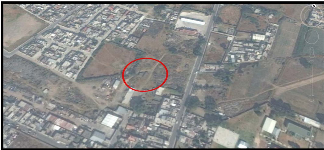
Figura 1.1 Ubicación del proyecto

El proyecto se ubica en Av. Hidalgo número 27, Pueblo San Sebastián Chimalpa, Municipio de la Paz, Estado de México.