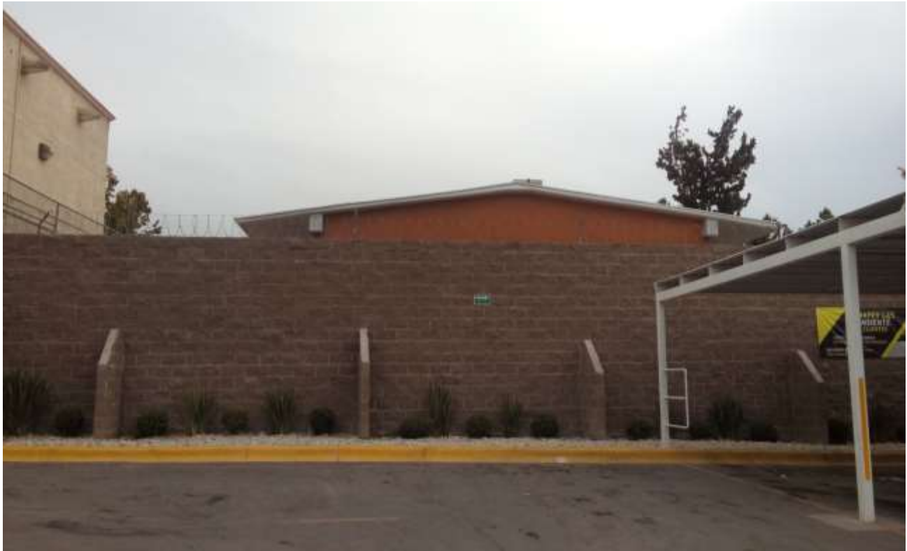
Colindancia Este con Escuela