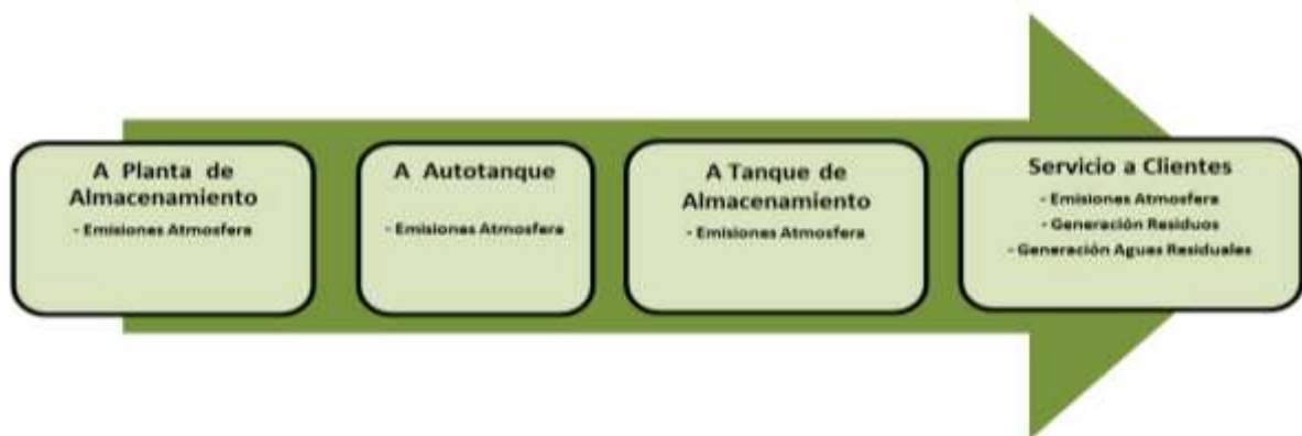
DIAGRAMA DE FLUJO DE LA OPERACIÓN DE LA ESTACION

En esta etapa se tendrá la generación de Residuos no peligrosos y peligrosos, aguas residuales y emisiones a la atmosfera.