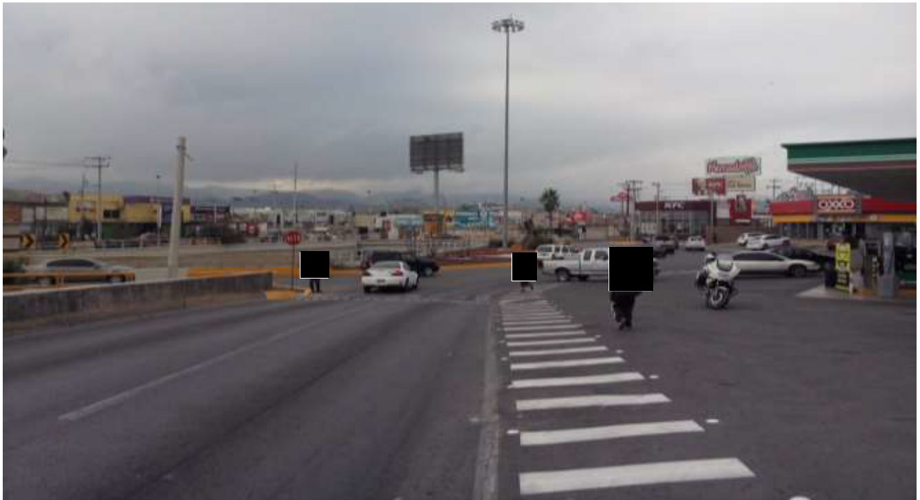
Colindancia Sur con Av. de la Juventud Luis Donaldo Colosio

Fotografía de personas físicas, artículo 113 fracción I de la LFTAIP y artículo 116 primer párrafo de la LGTAIP.