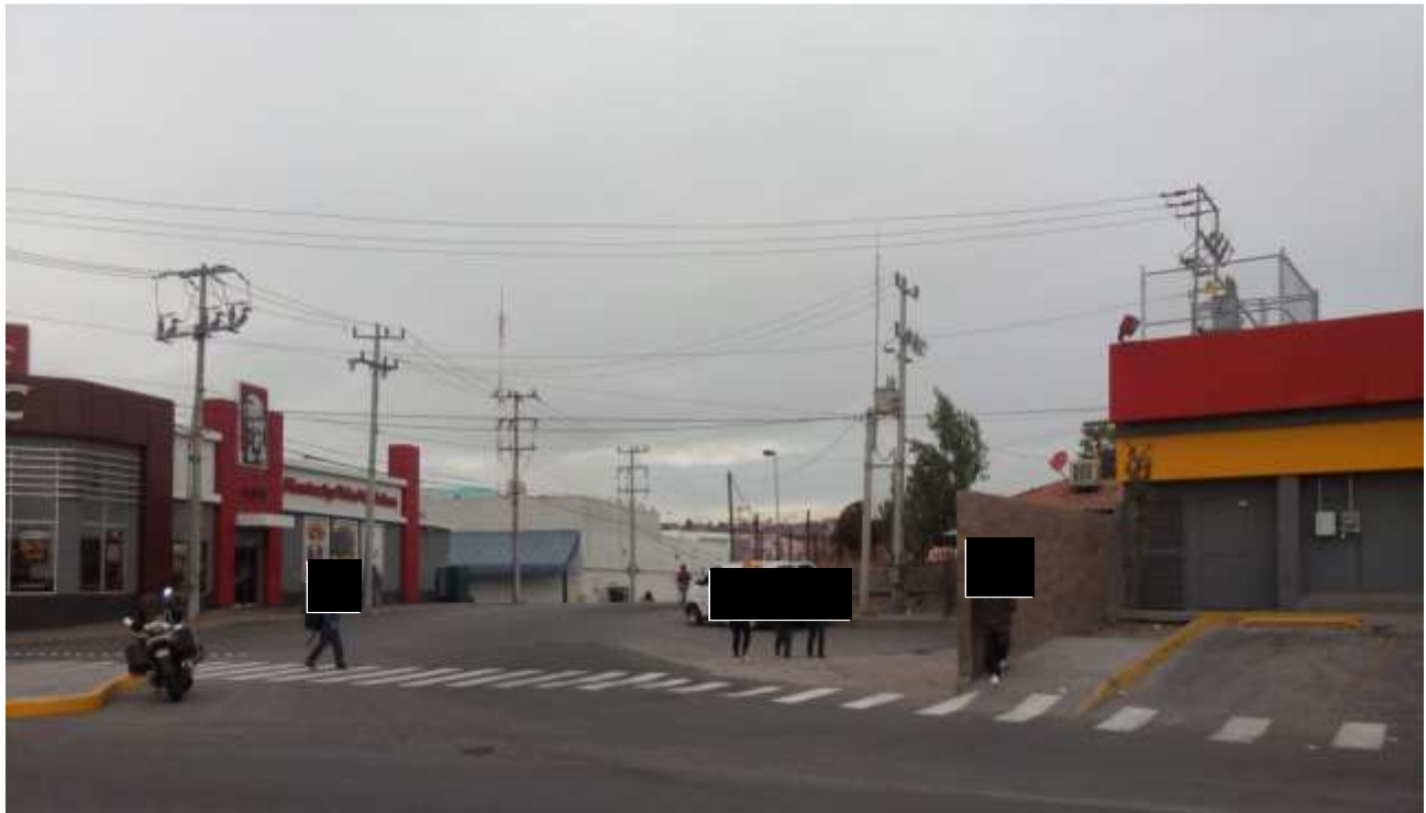
Colindancia Oeste con calle Presa Chuvistar

Fotografía de personas físicas, artículo 113 fracción I de la LFTAIP y artículo 116 primer párrafo de la LGTAIP.