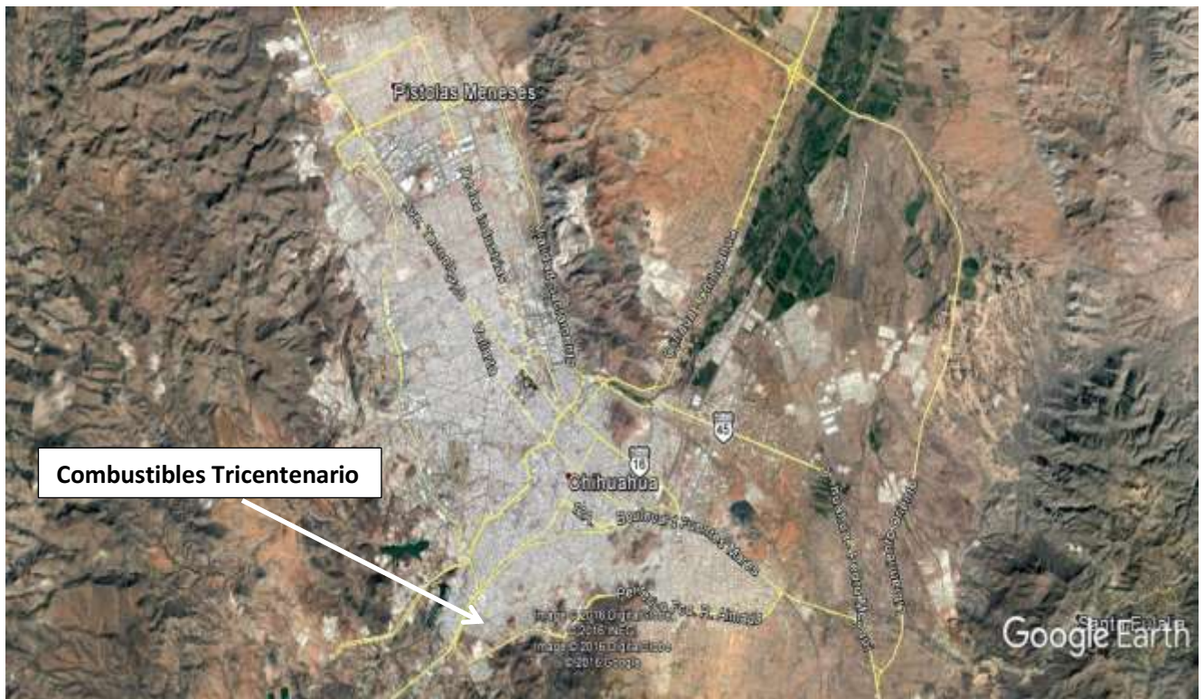
Ubicación de la estación en la ciudad de Chihuahua, Chih.