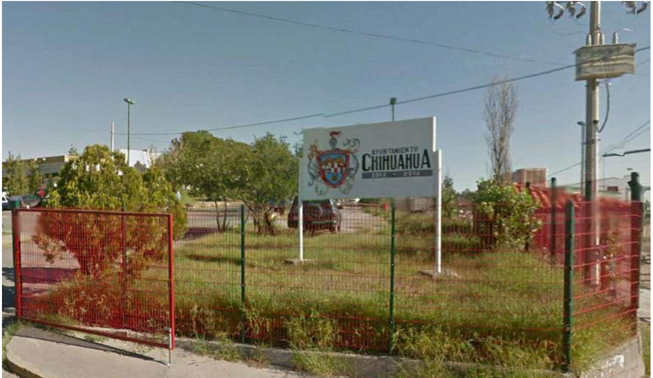
Colindancia Norte Estacionamiento Desarrollo Urbano Municipal