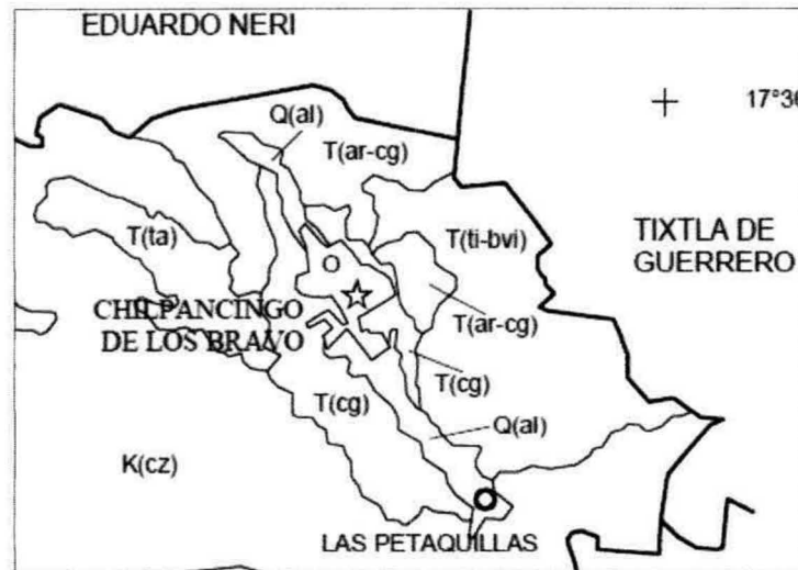
Mapa Geológico en la zona de Estudio.

La Sierra Madre del Sur que se desarrolla a lo largo de 500 kilómetros, paralela a la costa pacífica, posee la característica de tener su cresta a una altitud de 2,000 metros, sin embargo cuenta con algunas elevaciones que sobrepasan los 3,000 metros sobre el nivel del mar, localizadas en el sector occidental y que constituyen las cumbres más elevadas de la entidad guerrerense.