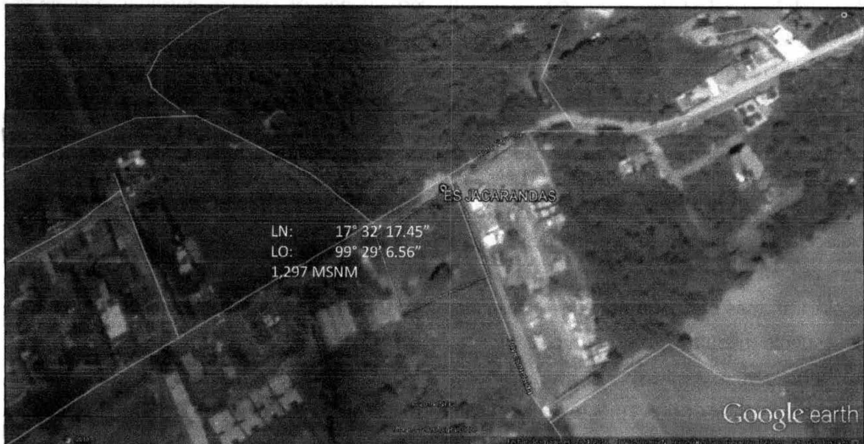
Área de influencia del proyecto.

Describiendo las condiciones actuales del terreno seleccionado para la instalación del proyecto, se encontró un predio ya previamente preparado, debido al status de propiedad privada, éste se encontró con el nivel ajustado para comienzo de las actividades constructivas. Cabe mencionar, que no poseía vegetación original, debido a que se encuentra en área urbana con escenarios colindantes previamente impactados por la actividad urbanística. En cuanto a la fauna, ésta es prácticamente inexistente, sólo se logró observar insectos pequeños y aves menores, descartando la existencia de especies protegidas por las leyes ambientales en la materia.