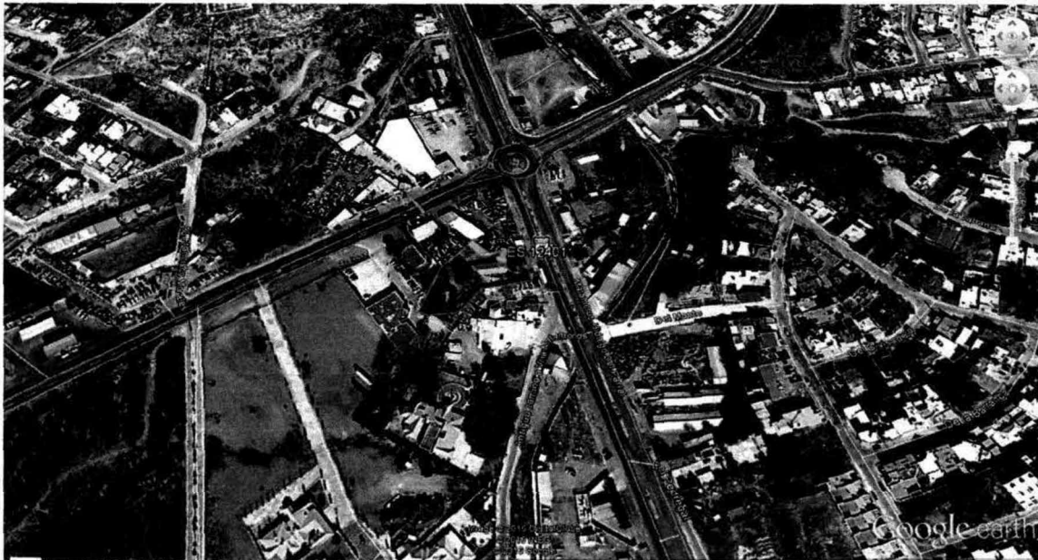
CUADRO DE AREAS