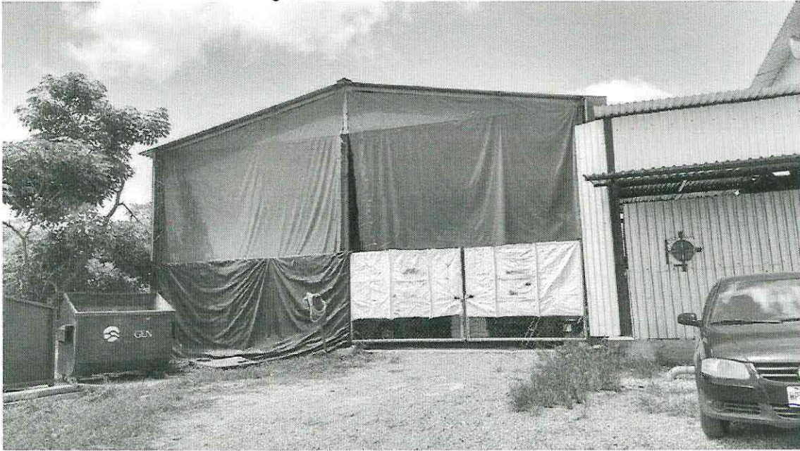
Imagen 12.- Foto del Almacén General

[Handwritten signatures and initials in blue ink, including a large signature and several smaller initials.]