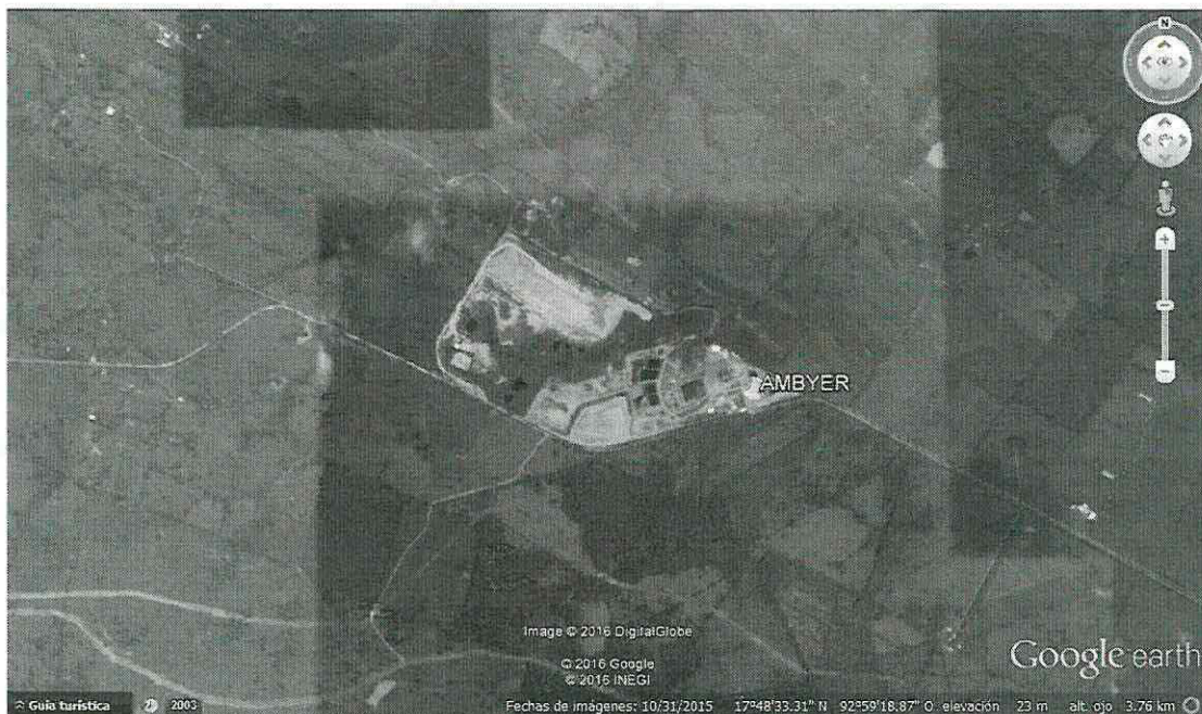
Imagen 1.- Ubicación de la instalación denominada CENTRO DE TRATAMIENTO AMBYER ubicada en Camino Vecinal A Ranchería Alvarado 2da Sección, Km 6, Municipio De Centro, Estado De Tabasco, de la empresa AMBIENTAL Y ENERGÍA RACIONAL S.A. DE C.V.

[Handwritten signature] [Handwritten signature]