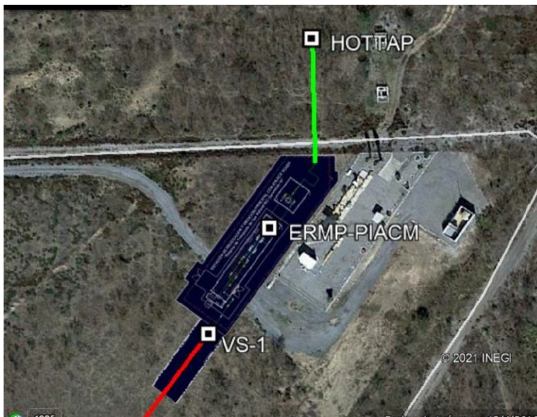
Figura 1. Gasoducto Ø24” – Reynosa – Chihuahua HOT TAP

Para la conexión del “Sistema de Transporte de Gas Natural RIC Generación IV” con el SISTRANGAS se considerarán las interconexiones con los Gasoductos siguientes: