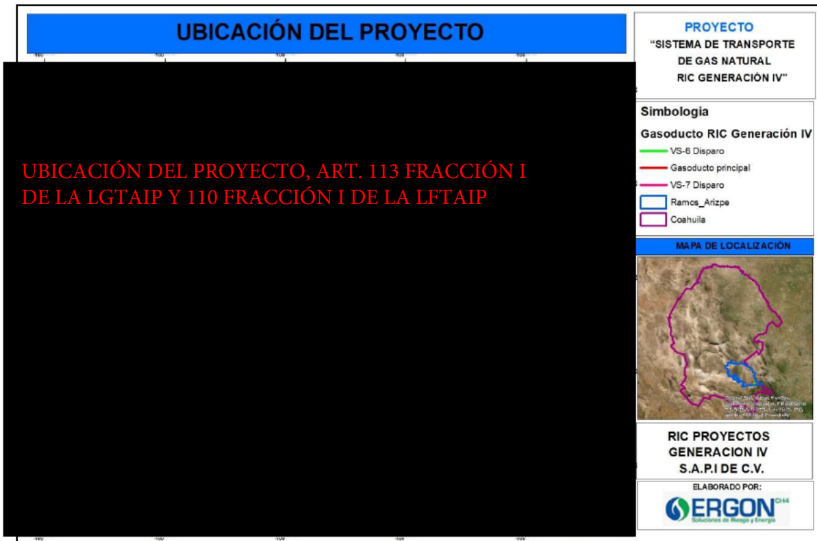
Figura 2. Ubicación del proyecto “SISTEMA DE TRANSPORTE DE GAS NATURAL RIC GENERACIÓN IV”.

Las coordenadas donde se pretenden ubicar las instalaciones superficiales del Sistema de Transporte de Gas Natural son las siguientes: