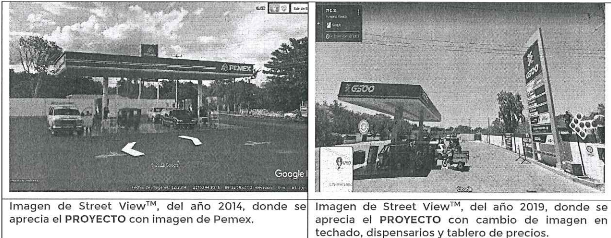
Imagen de Street View™, del año 2014, donde se aprecia el PROYECTO con imagen de Pemex.