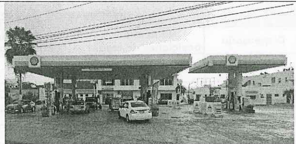
Imagen de Street View™, de enero de 2022, donde se aprecia el PROYECTO con cambio de imagen en techado, dispensarios y tablero de precios.

Derivado de lo anterior, el REGULADO realizó cambio de imagen sin haber contado previamente con autorización y/o pronunciamiento en materia de impacto ambiental por parte de la autoridad competente; conforme lo señalado en el artículo 6o., fracciones I, II y III del Reglamento de la Ley General del Equilibrio Ecológico y la Protección al Medio Ambiente de Evaluación de Impacto Ambiental (REIA), por lo que el REGULADO deberá acudir a la Dirección General de Supervisión, Inspección y Vigilancia Comercial adscrita a la Unidad de Supervisión, Inspección y Vigilancia Industrial para que, en el ámbito de sus atribuciones de inspección y vigilancia, determine lo conducente.