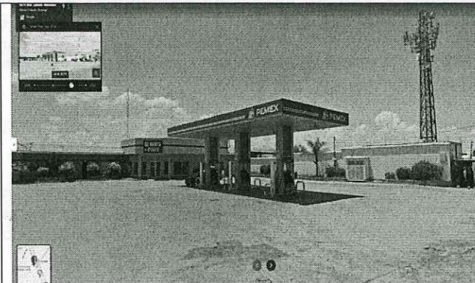
Imagen de Street View™, de mayo 2019, donde se aprecia el PROYECTO con imagen de Pemex.

Derivado de lo anterior, esta DGGC concluye que el PROYECTO cuenta con autorización ambiental que ampara el desarrollo del PROYECTO mediante oficio número SRNyMA/242/DMA/580/2003 emitida por la Secretaría de Recursos Naturales y Medio Ambiente del estado de Durango de fecha 20 de agosto de 2003, no obstante lo anterior, derivado del análisis realizado por ésta DGGC se advierte que, se han desarrollado modificaciones al PROYECTO , toda vez que, al georreferenciar las coordenadas proporcionadas en la información adicional, en el Software de acceso libre Google Earth Pro™ y Street View™, esta DGGC identificó cambios, ampliaciones, modificaciones, sustituciones de infraestructura, rehabilitación y/o mantenimiento de instalaciones al PROYECTO , como se puede apreciar en las siguientes imágenes: