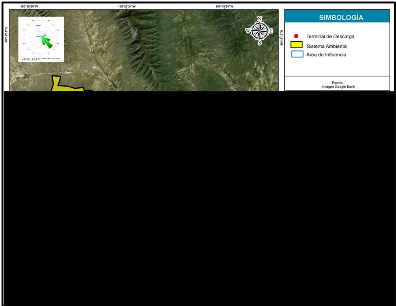
Figura 2. Localización y límites del Sistema Ambiental y Área de Influencia del Proyecto. UBICACIÓN DEL PROYECTO, ART. 113 FRACCIÓN I DE LA LGTAIP Y 110 FRACCIÓN I DE LA LFTAIP.

En la Figura 2 muestra la ubicación del Sistema Ambiental y el Área de Influencia para el Proyecto Terminal de Descarga HISENSE: