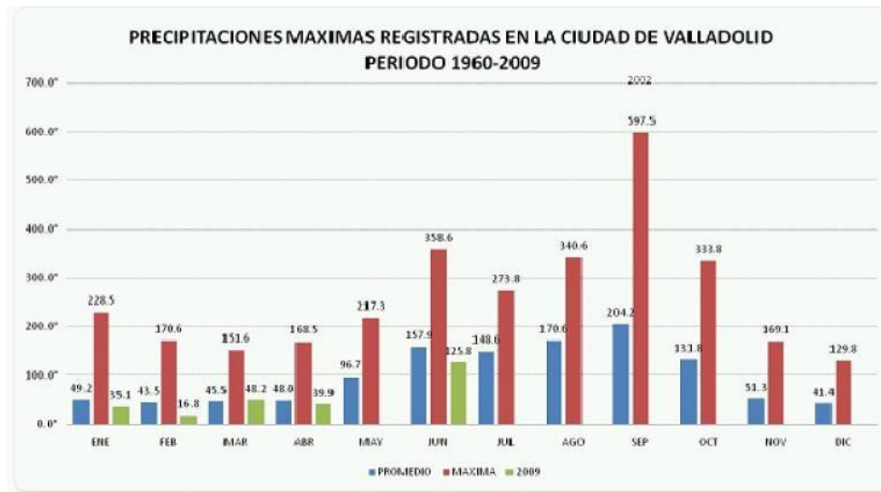
Precipitación máxima histórica mensual CNA 2008.

A continuación se muestra el comportamiento de la precipitación máxima mensual, del periodo 1960- 2009: