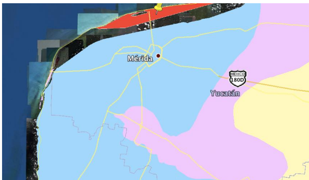
Parámetros climáticos promedio de Mérida (1951–2010)

Temperaturas promedio en a ciudad de Mérida, Yucatán.